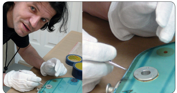
Fot. 09 NASA ARISS 2007