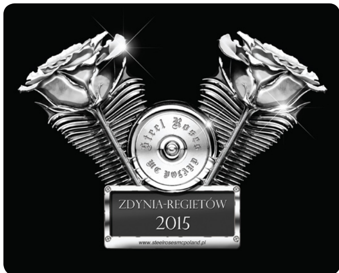
Fot. 11 Steel Roses logo 2015