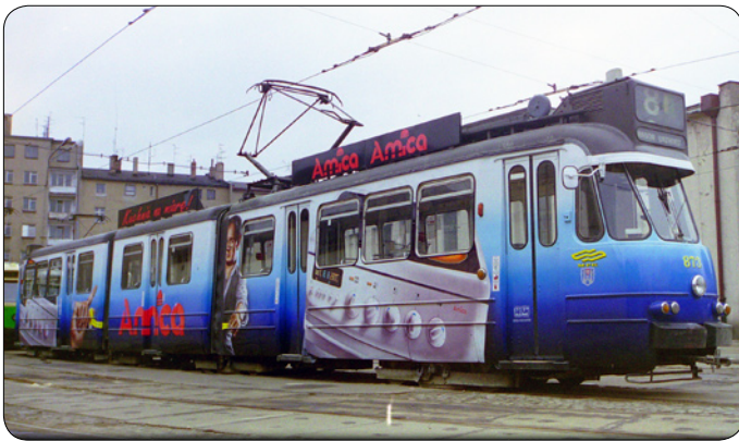
Fot. 07 Tramwaj Amica 1996

czy inne symbole, które określam mianem „trupizmu”. Ja się zawsze fascynowałem życiem, a nie śmiercią, więc „trupizmowi” mówię: nie. Z czasem usamodzielniałem się, urządziłem pracownię w wynajętym garażu, cały czas pozostając w bardzo dobrych stosunkach z Auto – Lackiem. Potem ożywiły się moje kontakty z kolegami plastykami. Wykonałem m.in. plakat dla Tonsilu, czyli producenta głośników z Wrześni. Potem, gdy już wynajmowałem hangar do malowania samochodów ciężarowych, dostałem zlecenie od Agencji Reklamowej Just. Pomalowałem 40 polonezów trucków dla Kompanii Piwowarskiej według projektu Just. W latach 1993 - 1996 brałem udział w wystawach airbrush w Niemczech i na Targach Reklamowych w Poznaniu. Stoiska były drogie, ale warto było zainwestować. Potem zaprojektowałem m.in. całą szatę graficzną produktów firmy Multichem, a przez Agencję Reklamową Reklamy Merkury dostałem zlecenie na pomalowanie reklam na 20 tramwajach w całej Polsce. Malowanych ręcznie, bo nadal nie było jeszcze wydruków wielkoformatowych. Miały reklamować Amicę Wronki. Potem posypały się kolejne, tramwajowe zlecenia, m.in. od firmy Levis, AEG itd. To był dla mnie przełom. Mogłem pomyśleć o budowie swojej pracowni. (fot. 07)