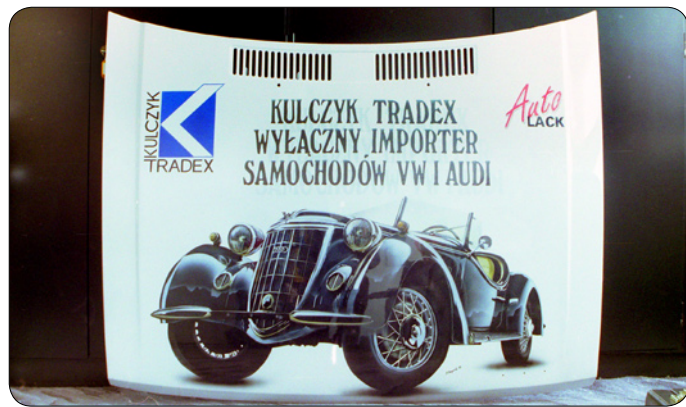
Fot. 05 AutoLack Kulczyk 1992