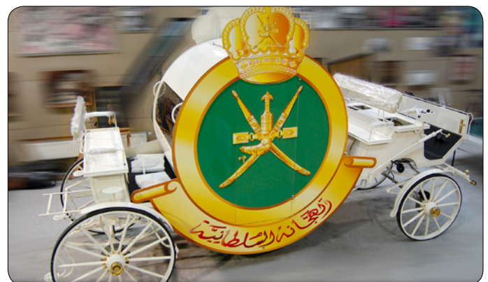
Fot. 10 Pajkon Oman 2010

- I 1,5 miesiąca pracy od podstaw nad stworzeniem graficznego logotypu herbu, który można by powiększyć do 2-3 metrów. Bo okazało się, że w Omanie takiego brak. A herb miał zdobić obie burty dwóch powozów, powstających w pracowni pod Poznaniem. Z kuloodpornymi szybami, ze skrzyniami na dachu, z których miały wyfrunąć 40 gołębi. Miały być ciągnięte przez bodaj 6 wielbłądów. Ot, przyjemności możliwych tego świata. Na malowanie nie było czasu. Po wykonaniu precyzyjnego pliku wektorowego, wydrukowaliśmy go na specjalnej, super odpornej na wysokie temperatury folii. Uroczystości transmitowała telewizja Al. Jazeera. To była piękna przygoda. (fot. 10)