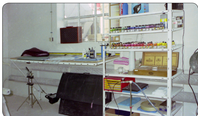
Fot. 04 AutoLack 1992

- Oczywiście: 50 herbów miasta Szamotuły (śmiej). Do powieszenia w biurach Urzędu Miasta. Znajomy tam pracował. Zapytał: