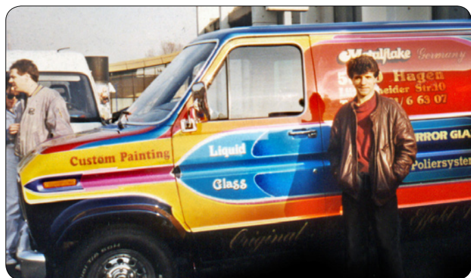
Fot. 03 Castrop Rauxell 1993

- Nie do końca. Rzeczywiście dużo się w Niemczech nauczyłem, ale królowała tam estetyka daleka od mojej. Ale to tam po raz pierwszy zobaczyłem na żywo jak przy pomocy aerografu można ozdobić pojazd. Bywałem na wystawach i pokazach airbrush. (fot. 03) Pamiętajmy, że lata 80-te, to były czasy, gdy w Polsce nie do zdobycia były zachodnie, branżowe katalogi czy pisma specjalistyczne. Wtedy, żeby poczytać np. o światowym jazzie, chodziło się do biblioteki konsulatu USA przy ul. Chopina. Miałem nawet tam swoją kartę.. Jednak w Niemczech największe wrażenie robiło na mnie to, co szwankowało w Polsce: organizacja pracy, porządek, czystość narzędzi, dyscyplina. Oni byli w tym świetni, choć z kolei brakowało im fantazji, abstrakcyjnej wyobraźni lub improwizacji. Teraz te różnice się zatępiły.