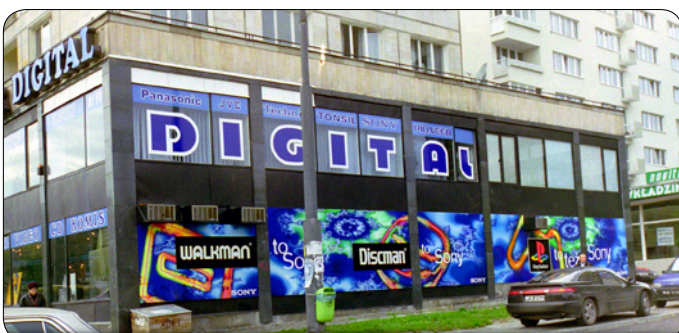
Fot. 08 Plansza Sony 1996

- Dostałem telefax od znanej, amerykańskiej agencji reklamowej Leo Burnett, której centrala mieści się w Nowym Jorku. Nie mogłem uwierzyć w to co przeczytałem. Miałem namalować wielką reklamę, zakrywającą nieciekawą elewację największego sklepu płytowego w Alejach Jerozolimskich, w którym Michael Jackson miał promować nową płytę w ramach „HIStory World Tour Warsaw '96”. Była ogromna – 30 m długości i 2,5 m wysokości. Projekt był dostarczony przez Leo Burnett, ja malowałem. Właściwie to była reklama Sony Music Poland Pamiętam jak z ekipą jechaliśmy z masą pomalowanych arkuszy blachy aluminiowej na przyczepie do Warszawy. Wyszło świetnie. To było coś – duży prestiż w agencjach reklamowych. (fot. 08)