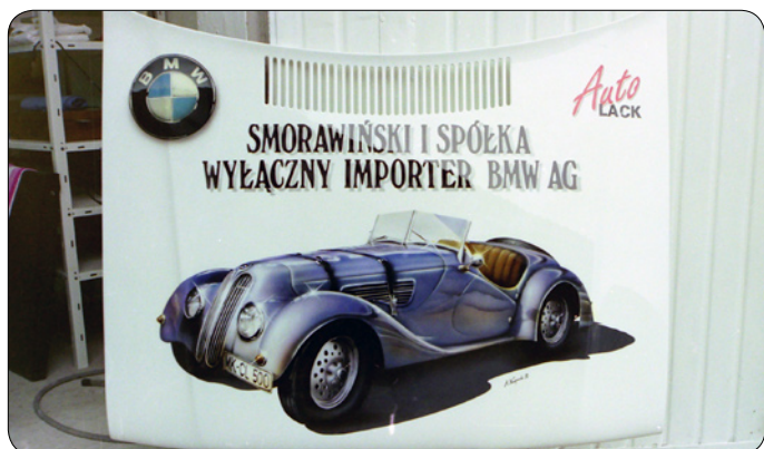
Fot. 06 AutoLack Smorawinski 1992